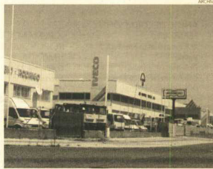
Borox amplía sus instalaciones para el sector empresarial.

Jesús Menchero García 1ª Fase, ha supuesto una inversión de 320 millones de euros y está previsto que cree unos 25.000 nuevos puestos de trabajo. La distribución del polígono se adapta a cualquier tipo de negocio o sector mediante diversas tipologías de naves y locales. Tendrá capacidad